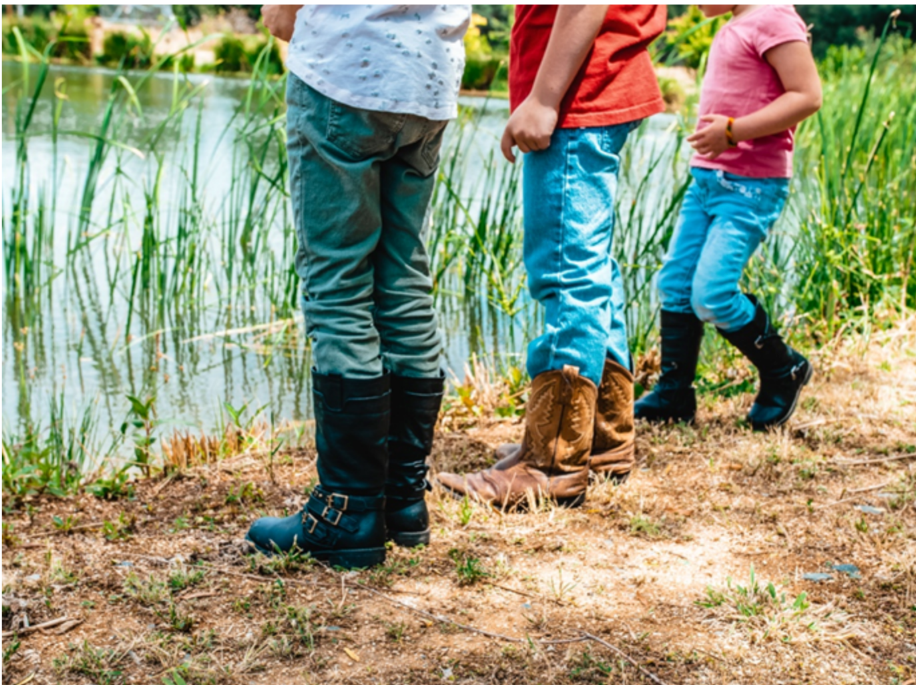
Les frères et sœurs